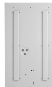
SinusPRO S 5000 48V