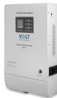
SinusPRO S 5000 48V