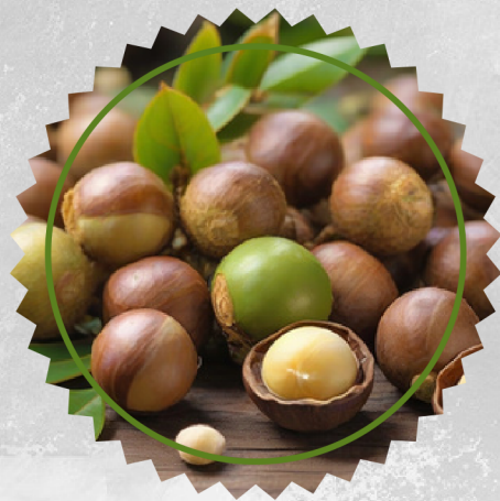
Macadamia Seed Oil