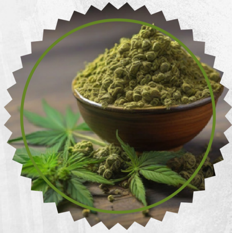
CBD & CBG