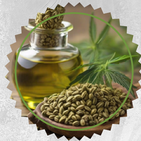
Olej z pestek konopi