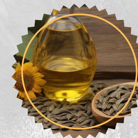
Olej z pestek słonecznika