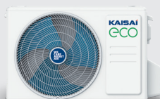
Jednostka zewnętrzna KEX