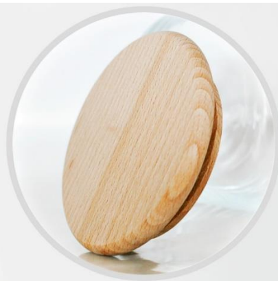
DREWNIANE WIECZKO łatwe otwieranie i zamykanie