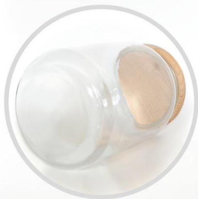
POGRUBIONE DNO wytrzymałość i trwałość