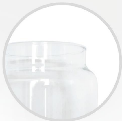
BEZOŁOWIOWE SZKŁO bezpieczne przechowywanie