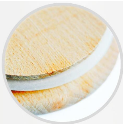
ELASTYCZNA OPASKA solidne uszczelnienie