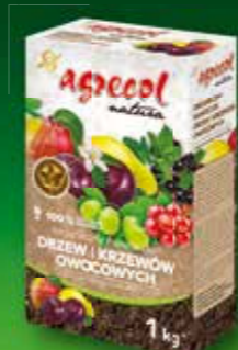
Organiczny nawóz do drzew i krzewów owocowych

Inne przydatne w uprawie produkty AGRECOL