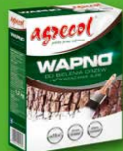
WAPNO – do bielienia pni drzew i odkwaszania gleby