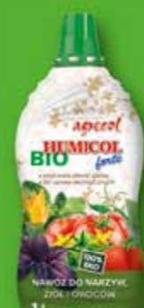
Biohumicol forte - nawóz do warzyw, ziół i owoców