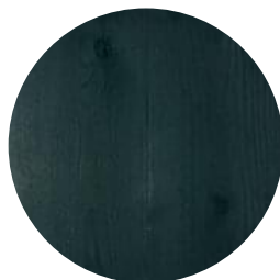
RUBIO MONOCOAT GREEN