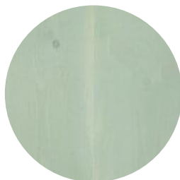
SALT LAKE GREEN