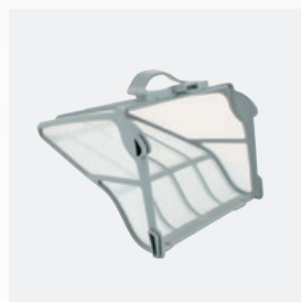
POJEMNIK FILTRA bardzo cienki, sztywny filtr o dużej pojemności (5 litrów)