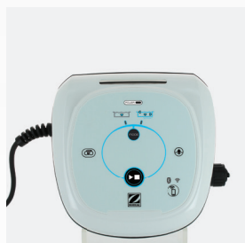
ZASILACZ- jednostka sterująca