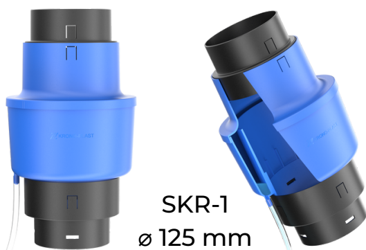
SKR-1 ø 125 mm

Produkt jest kompatybilny z kominkami wentylacyjnymi Krono-Plast oraz z systemowymi rurami przyłączeniowymi Kronoflex. Montaż skraplacza z produktami innych producentów może być utrudniony, może wymagać zastosowania dodatkowych elementów nie będących w zestawie lub być niemożliwy.