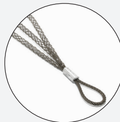
I-WS-PJ; I-WS-PD; I-WS-PT