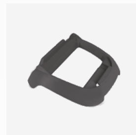
Podstawa pod zasilacz