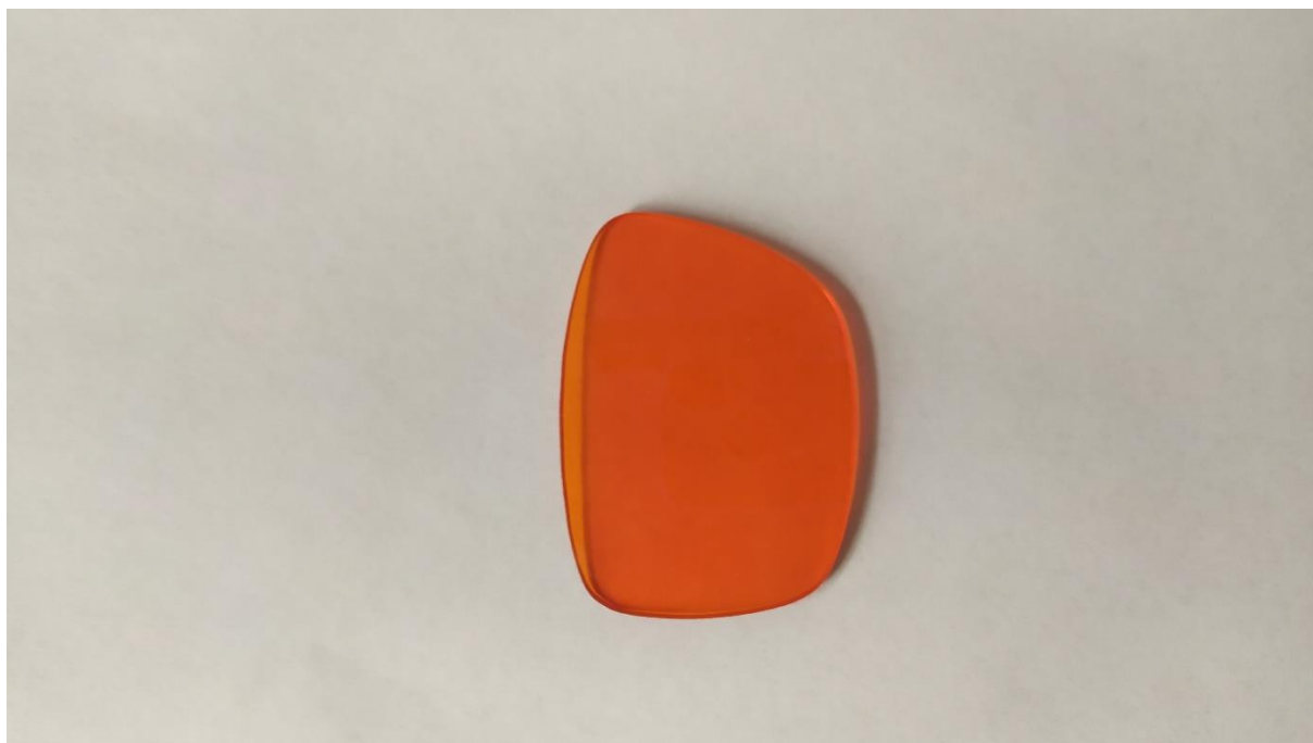
Zdjęcie próbki badanej