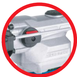
Aluminiowy korpus Aluminum body