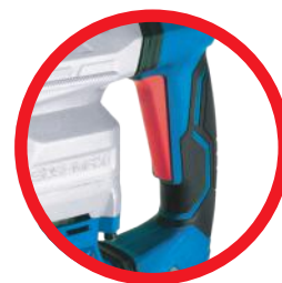
Gumowy uchwyt Soft grip