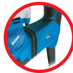
Dioda sygnalizująca podłączenie do zasilania Led indicating power connection