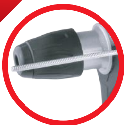
Ogranicznik głębokości Depth limiter