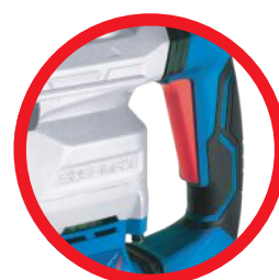
Wygodny przycisk startu Comfortable start switch