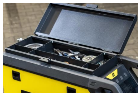
Volitelná horní přihrádka na příslušenství