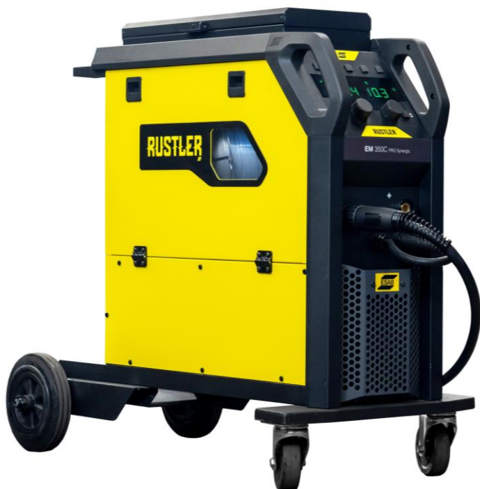
Rustler EM 350C PRO Synergic