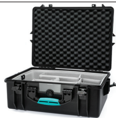
* second skin