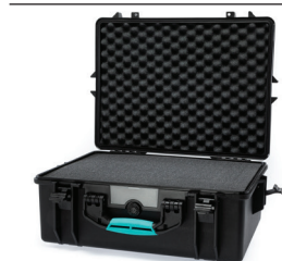
* cubed foam