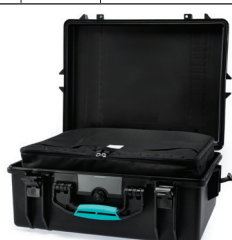
* interior bag